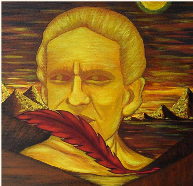
Pintura de Danitza Montalvo

Vallejo para algunos es un icono y para otros un desafío permanente. Para mí, es simplemente mi hermano horizontal que escribió sobre el hombre de todas las identidades y de todas las nacionalidades. Él, es un poeta de siempre, porque el tiempo está en sus poemas, está el pueblo, la geografía, además los lugares y la familia, está el Perú doloroso y marginado, está su lenguaje, su cultura y sus amigos caminan en su grandioso espíritu creador. (Juan Félix Cortés, Escritor)